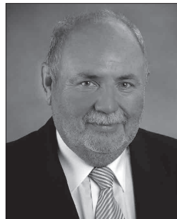
Töretlen erővel Városunkért!

Nem nagyon kell bemutatkoznom, hiszen képviselői, polgármesteri munkám révén ismernek, képet alkothattak eddigi tevékenységemről. Tudhatják, mennyire fontos nekem, hogy Dunaföldvár nemcsak a 21. század elvárásainak megfelelő, korszerű, az oktatásban, egészségügyben, a mindennapi élet ellátásában ►