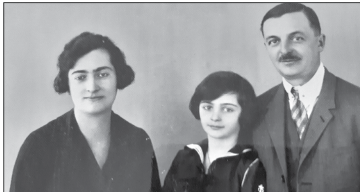
A Névery család

központi szereplője a zongora volt. Zene és énekszó töltötte be a házat, az estéket. Már Lenke édesanyját is „dalos dédi”-nek hívták az unokák. Bizonyára a budapesti kapcsolatok, a neveltetés és a kultúra magyarázza, hogy a Névery – Folkner család földvári házában és a szülőben lévő romantikus préházban, az ötvenes-hatvanas években olyan híres emberek is megfordultak, mint Kiss Ferenc, a Színművészeti Akadémia, majd a Nemzeti Színház igazgatója, akit az ötvenes években egy időre a hivatalos politika mellőzött, vagy Kövecses Béla, az Operaház magánénekes. De ebből a házból finom sült csülköt is tartalmazó csomagokat kapott nemegyszer Gyurkovics Mária Kossuth-díjas énekesnő is.