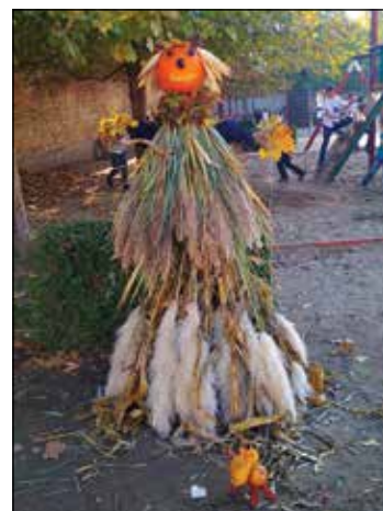
A Madonna kistesója az iskola udvarán