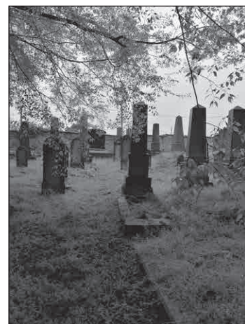
1.kép: Vadász utca, zsidó temető

130 év távolából is feltűnő, hogy az Izraelita Nőegylet és a Vöröskereszt közös jótékonyági rendezvényt szervezett (1888), ahol Kiss József költő, a zsidó-magyar költészet atyja volt a