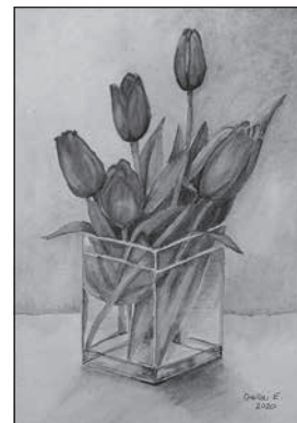
Gallai Erzsébet alkotása