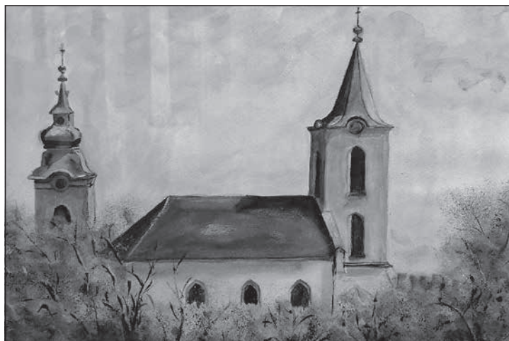
Forster Ferencné alkotása

lánban sajátított el. Az igazgatónő szerint az intézmény kellő számú és szaktudással rendelkező oktatógárdával kezdi az új tanévet. Minden érdeklődő fiatal szeretet-