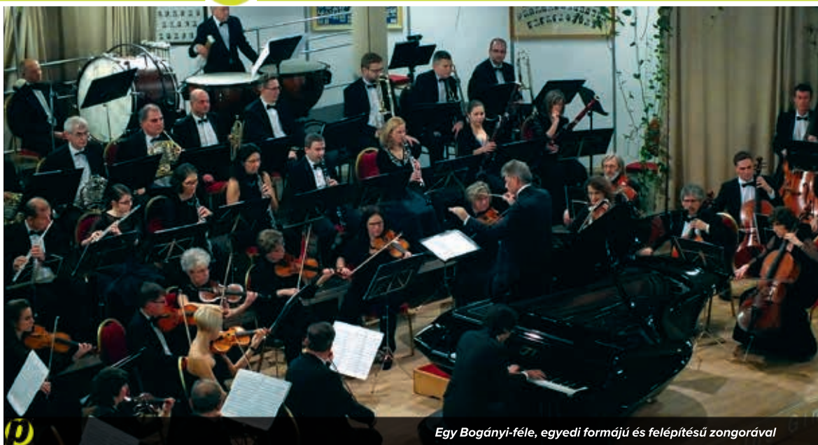
Egy Bogányi-féle, egyedi formájú és felépítésű zongorával

Aki annak idején látta Bereményi Géza Turné című filmjét, annak lehet egy kicsi sejtése, mek-