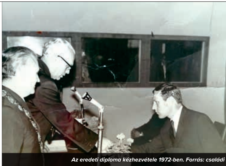
Az eredeti diploma kézhezvétele 1972-ben.

B.Z.: Mi, földváriak úgy hívtuk, hogy: a „földszöv.” A Szekszárdon fellelhető jegyzőkönyvekben olvastam – jellemző a helybeliek üzleti érzékére – , hogy a telepítések egy része már akkor exportcélú volt: pl.: spárga, torma, szamóca, málna, gyógynövények ültetése valósult meg. 40.000 számocatövet osztottak ki, s az itteni műtrágyaraktár Földvártól Faddig látta el az igénylőket, s a mennyiség felét Dunaföldvár használta