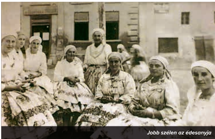
Jobb széken az édesanyja