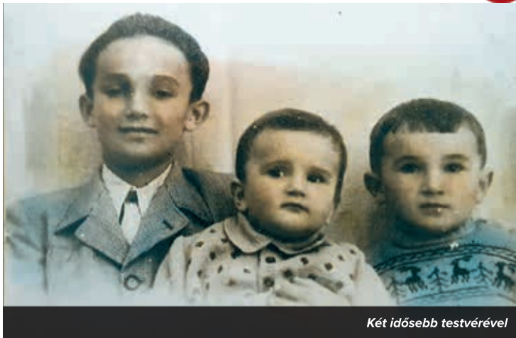
Két idősebb testvérével

► testvérekhez. A kilenc évvel idősebb bátyámat nem engedték oda tanulni, ahová menni szeretett volna, így menekült Debrecenbe, és végzett végül teológiát. A középső testvéremet már eltűrték, ő tanár lett, engem meg már, mint fizikai dolgozók gyermekét mindenki segített a tanulmányaimban.