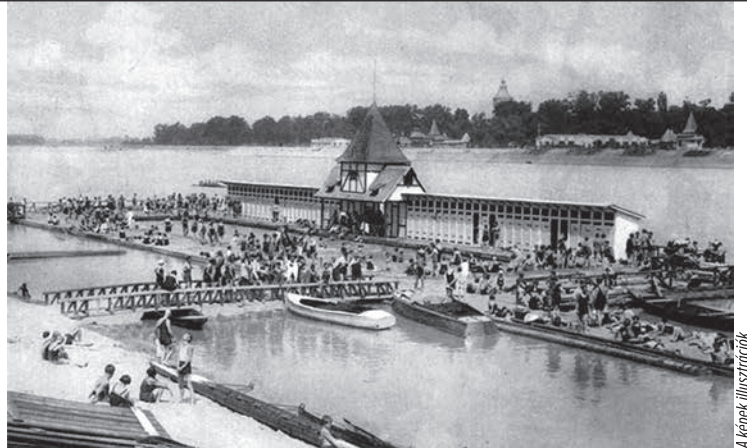
A képek illusztrációk

A fürdő élt majdnem 6 évet. (1889. június 22. – 1895. június 21.)