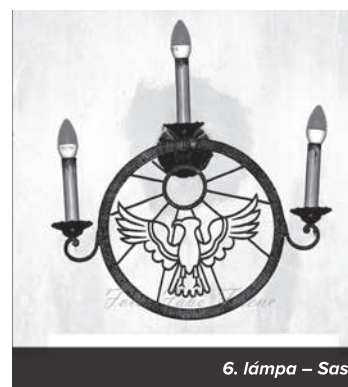
6. lámpa – Sas