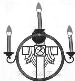
4. lámpa – Húsvét

A 7.falilámpa már pünkösödöt, vagyis a Szentlélek eljövételét, az Egyház alapításának ünnepét szimbolizálja. Közepén a Szentlelket jelentő galambot látjuk, ezt veszi körbe a tizenegy lángnyelv. Júdás árulása miatt egyetlen kevesebb az apostolok száma. «