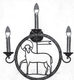
5. lámpa – Feltámadás