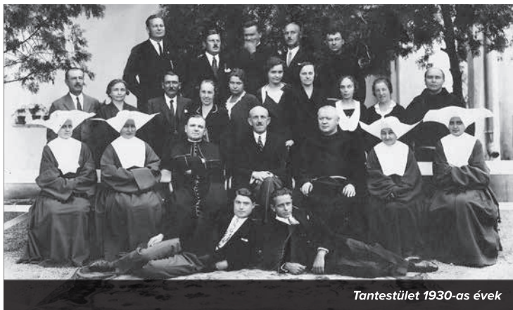
Tantestület 1930-as évek