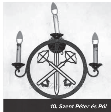
10. Szent Péter és Pál