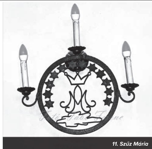
11. Szűz Mária

Sirák fia könyvében a Mária vonatkozás az egyik legszebb rész: „Jó illatot árasztok, mint a szőlőtő, és virágomból pompás, dús gyümölcs terem. Anyja vagyok a szép szeretetnek, az istenfélelemnek, megismerésnek és a szent reménynek. Nálam van az út és az igazság minden kegyelme, nálam az élet és az erény minden reménye. Jöjjetek hozzám mind, akik kívántok engem, és teljete el gyümölcsseimmel, mert lelkem édesebb a méznel, és birtoklásom jobb a lépés méz-