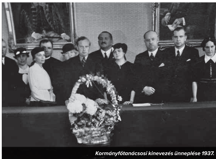
Kormányfőtanácsosi kinevezés ünneplése 1937.

december 20-án. Ideiglenes jelleggel Dudaron temették el, majd a második világháború befejezése után hamvai a dunaföldvári Fehérvári utcai temetőbe kerültek.