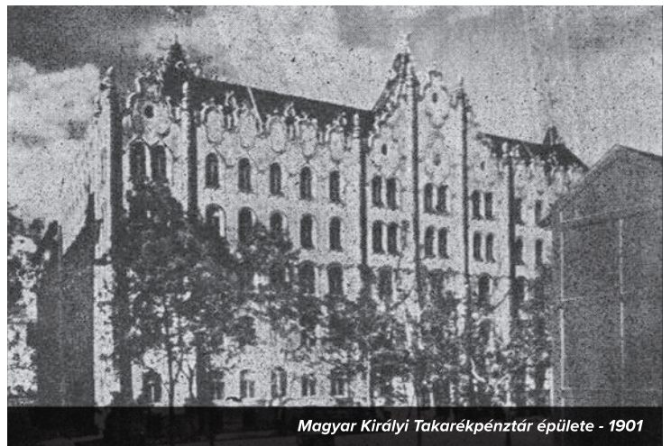
Magyar Királyi Takarékpénztár épülete - 1901

Fáradhatatlan munkabírásként jellemezte. Kezdeményezte a hazai csekkforgalom és hitelüzletek, valamint az iskolai takarékpénztárak elindítását. Gazdasági szakíróként és kutatóként a magyarországi pénzügyek, elsősorban a községi ►