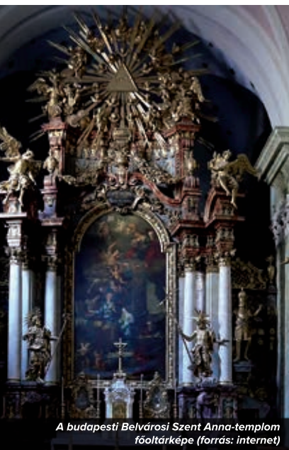
A budapesti Belvárosi Szent Anna-templom főoltárképe

megfestették, mint Murillo. A mi templomunk főoltárképével szinte megegyező ábrázolást láthatunk Budapesten a Belvárosi Szent Anna-templom (V. ker. Szervita tér 6.) főoltárképén. A rendkívüli hasonlóság mellett különbözik a rózsaszimbólum ábrázolásában. A rózsának és a színeknek jelképes jelentése van. A fiatal Mária mindkét képen fehér ruhát visel, alakját kék köpeny burkolja be. A klasszikus Mária-ábrázolásokon a ruha ►